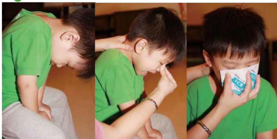
流鼻血時宜坐直或 稍微向前傾